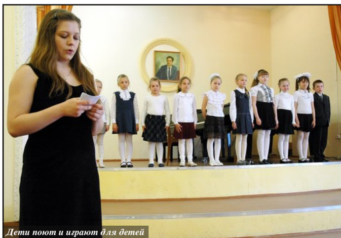
Дети поют и играют для детей

Последние концерты в этом сезоне состоятся 15 и 16 мая и посвящены они бу-