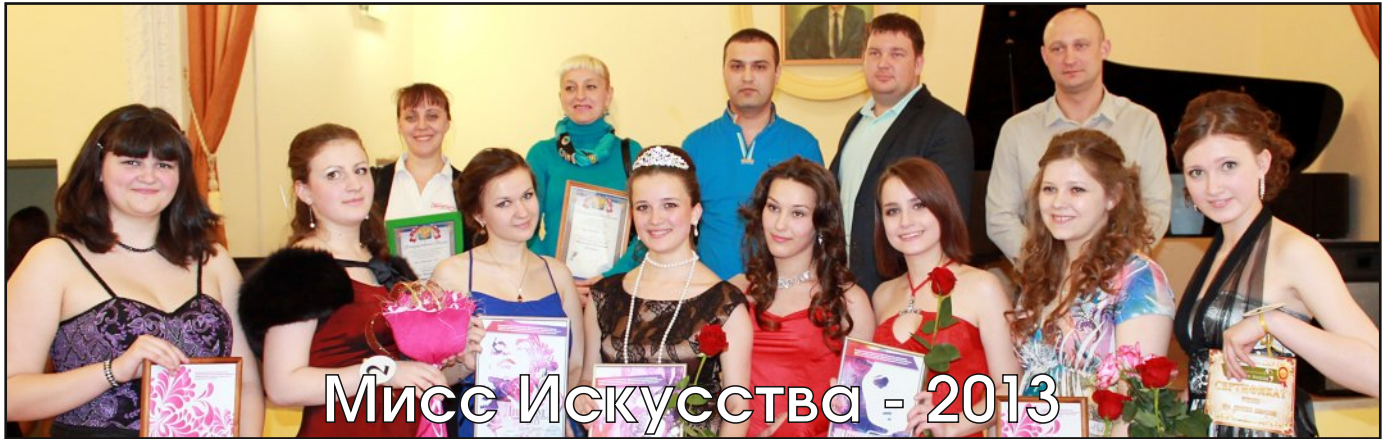
Мисс Искусства - 2013