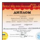
Фольклорный ансамбль "Особинка"